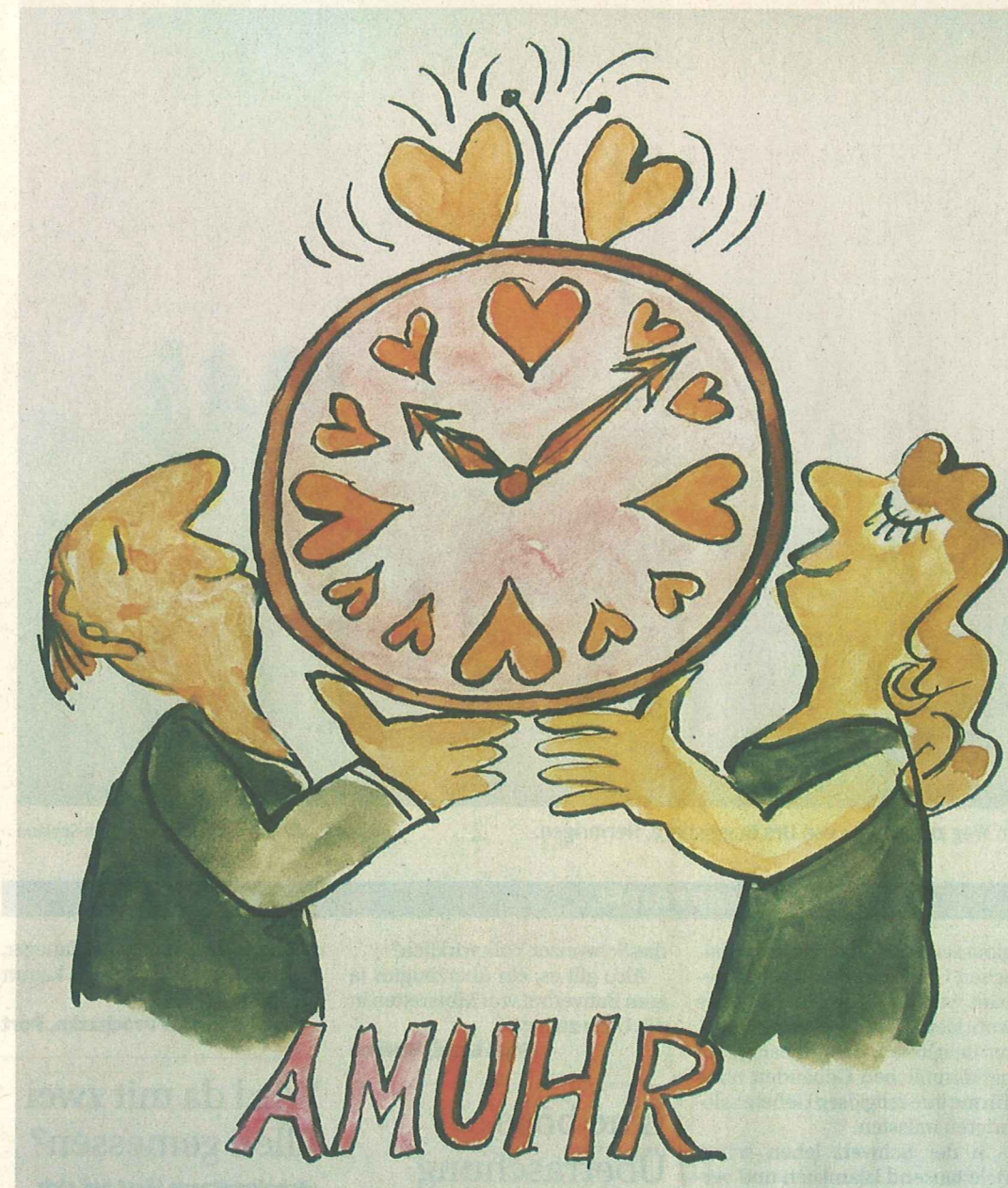
Sprachwitz und reizende Ideen: Karikatur von Ted Scapa.

Scapas einfache und direkte Zeichnungen bringen auf den