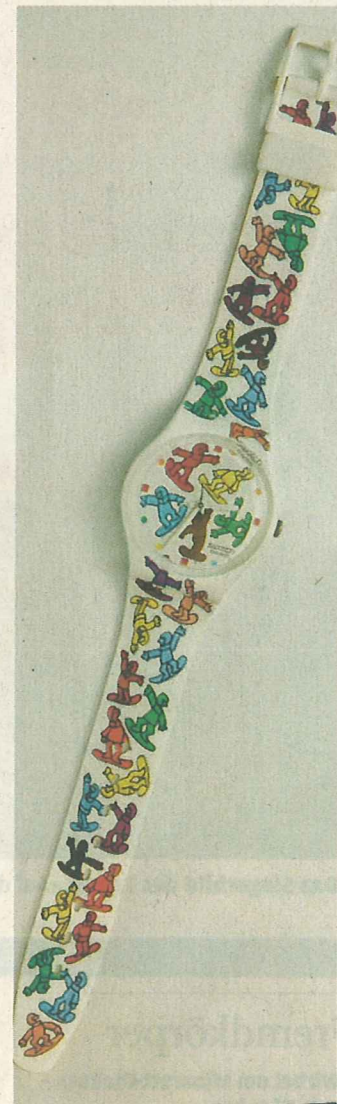
Vierte Swatch von Scapa.

INFO: Scapa, Temps-Zeit-Time. Cité du Temps, Pont de la Machine, Genf. Bis 30. Nov. 2009. Buch im Parlevvent Verlag ISBN 978-3-033-02198-3.