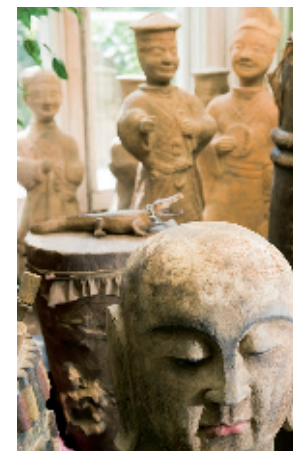
SCHLOSS VALLAMAND - EIN MÄCHTIGES DACH, UNTER DEM MENSCHLICHKEIT ZUHAUSE IST.