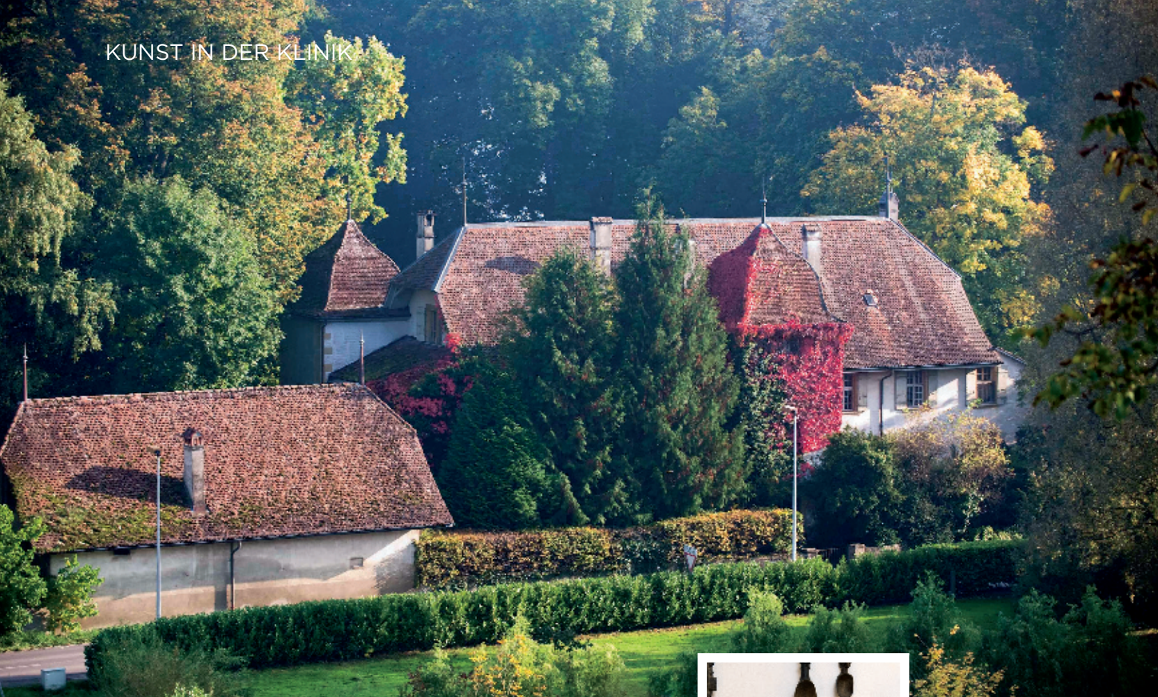
DER 30 000 QUADRATMETER GROSSE PARK VON SCHLOSS VALLAMAND AM UFER DES MURTENSEES GLEICHT EINEM VERWUNSCHENEN PARADIES, IN DEM DIE KREATIVITÄT IHRE KRAFT SCHÖPFT.

Lunchbuffet von Tochter Tessa steht bereit. Ich beschliesse, noch einmal wiederzukommen, um ganz in Ruhe die unzähligen Kunstwerke des Meisters zu betrachten.