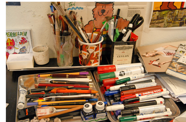
Scapas «Werkzeuge»: Filz- und Bleistifte, Kugelschreiber, Pinsel...

Den Kalender kann man bestellen unter: atelier-scapa@bluewin.ch, www.scapa.ch oder 031 312 32 00. Er kostet Fr. 38.00 plus Porto und Verpackung.